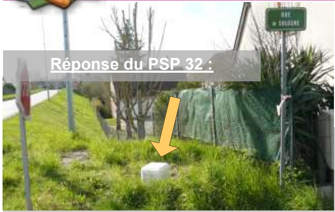
Réponse du PSP 32 :