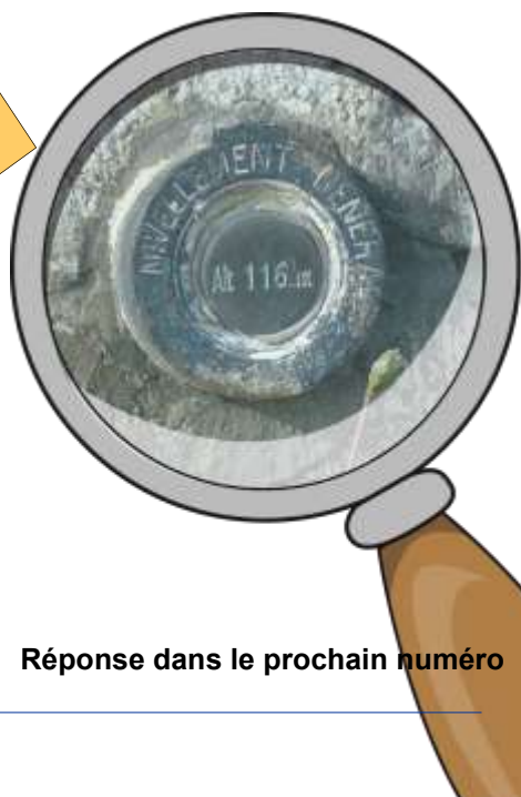
Réponse dans le prochain numéro

Quelques explications sur les bornes. Cylindriques ou carrées, trois types de bornes jalonnent le fleuve : Les bornes carrées sont des bornes-repères de nivellement situées aussi bien sur la rive gauche que sur la rive droite de la Loire. Elles sont gravées d'un numéro suivi d'une lettre. Le « M » signifie montant (amont), le « D » descendant (aval). La numérotation part du Méridien de Paris. La borne 0 se trouve sur la levée de Loire entre Saint-Père-sur-Loire et Saint-Benoît-sur-Loire ainsi que sur la rive gauche. Implantées sur des points hauts comme les levées, elles sont espacées d'un kilomètre réel environ.