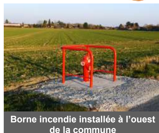
Borne incendie installée à l'ouest de la commune